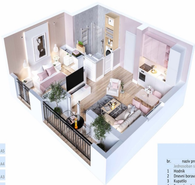
STANovi SA POGLEDOM