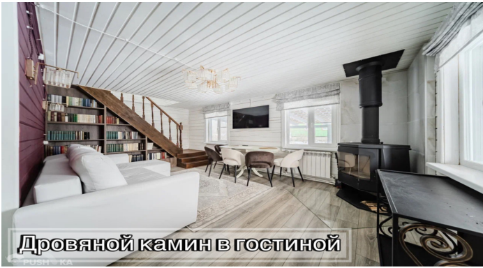
Дровяной камин в гостиной