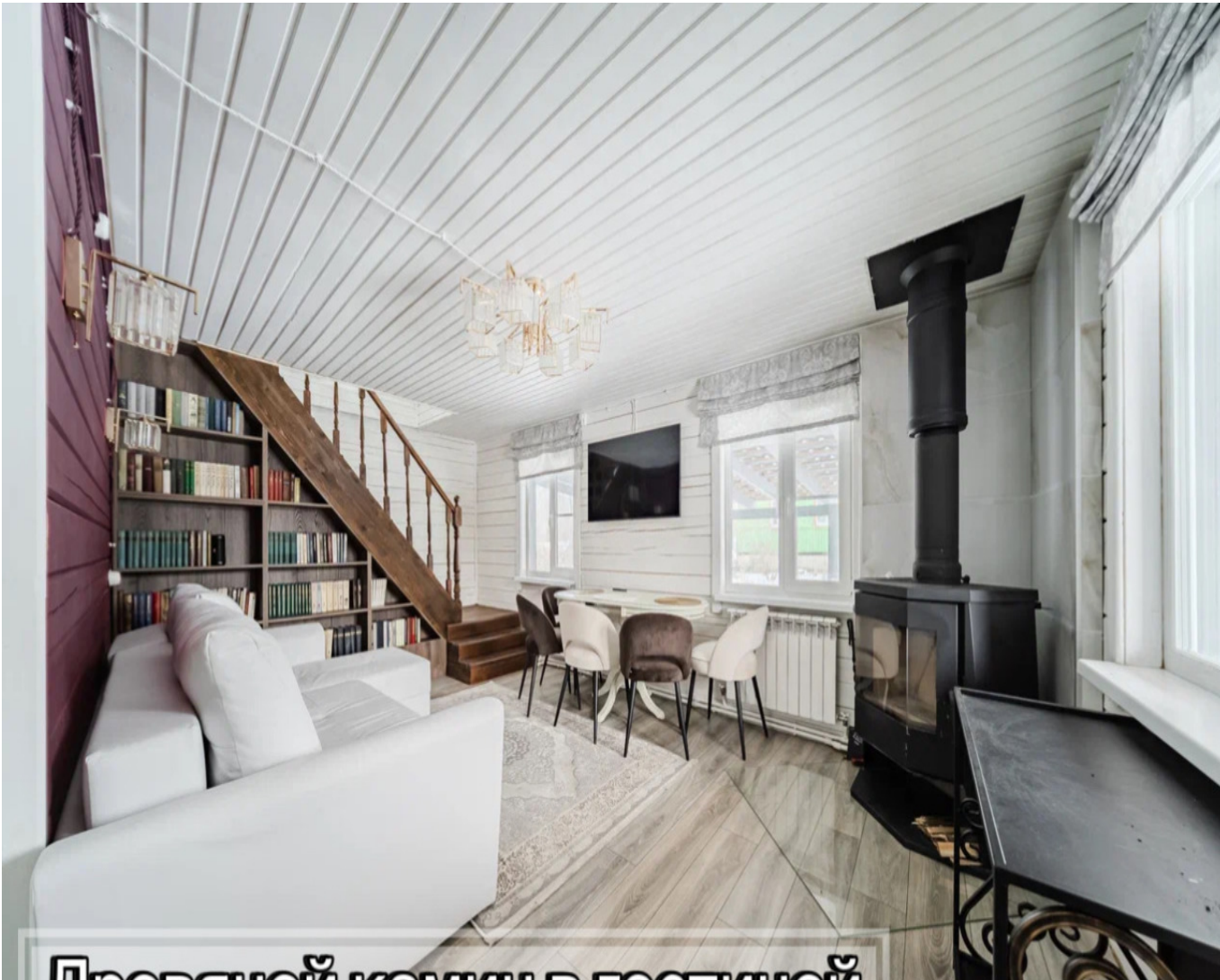
Дровяной камин в гостиной