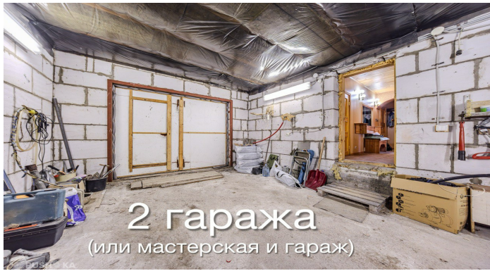
2 гаража (или мастерская и гараж)