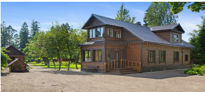
Дом с мансардой 100 м 2 , 15 терраса, баня на дровах, эл-во 15 кВт, колодец с насосом 8 колец, септик