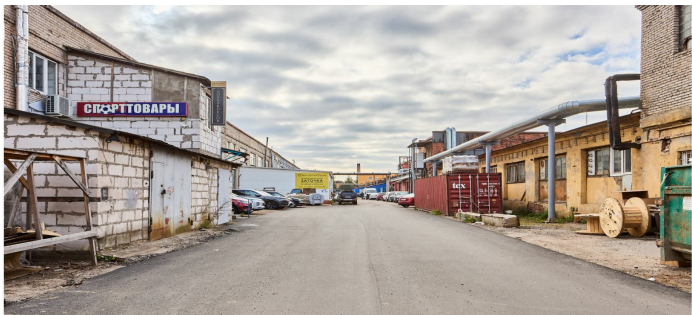
Промышленное здание 1642 кв.м., асфальтированная прилегающая территория, парковка для 15 а/м